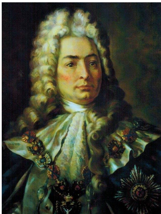
Павел Иванович Ягужинский

В период правления Анны Иоановны и последующие годы прокуратура практически бездействовала. Елизавета I Указом от 1741 г. восстанавливает деятельность прокуратуры как надзорного государственного органа. В период царствования Екатерины II был существенно усилен местный прокурорский надзор. При Павле I, который стремился все созданное Екатериной II переделать, был значительно ослаблен прокурорский надзор, сокращены штаты органов прокуратуры. Однако в целом прокуратура продолжала осуществлять свою деятельность.