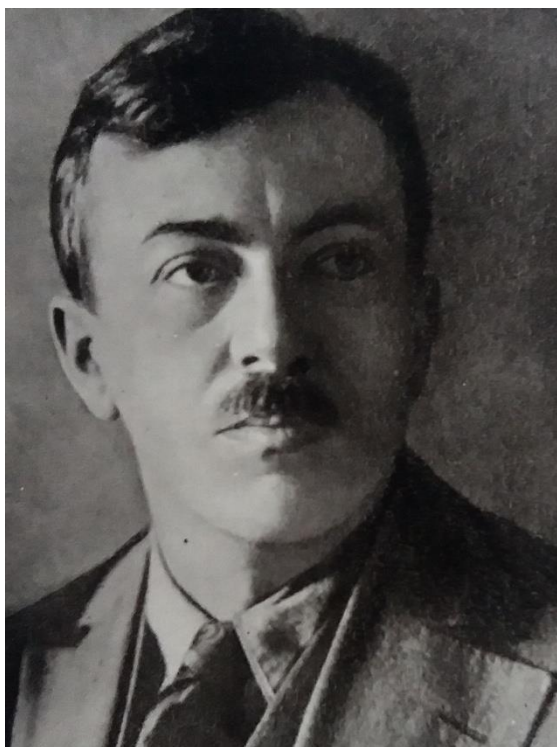
Иван Алексеевич Акулов

Прокурор Союза ССР назначался на должность ЦИК СССР и был ему подотчетен. Первым Прокурором Союза ССР стал И.А. Акулов. Конституция СССР 1936 г. вводит понятие высшего надзора за исполнением законов, который осуществлял Прокурор Союза ССР. Он назначался на должность Верховным Советом СССР; все нижестоящие прокуроры назначались Прокурором Союза ССР. Указом Президиума Верховного Совета СССР от 22 июня 1941 г. «О военном положении» работа всех органов прокуратуры была перестроена на военный лад. Прокуратура осуществляла надзор за исполнением законов военного времени, обеспечивала исполнение законов о поставке военной продукции, об оказании помощи фронту и укреплении тыла. В послевоенное время деятельность органов прокуратуры была направлена на укрепление законности в сфере экономики, а именно на обеспечение соблюдения экономии ресурсов страны.